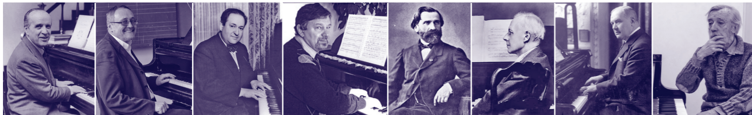
Rota Selmeczi Korngold Dubrovay Verdi Bartók Lehár Vidovszky

Plusz , mert: magyar színházakkal létrejött koprodukcióival felélénkíti a magyar operajátszást